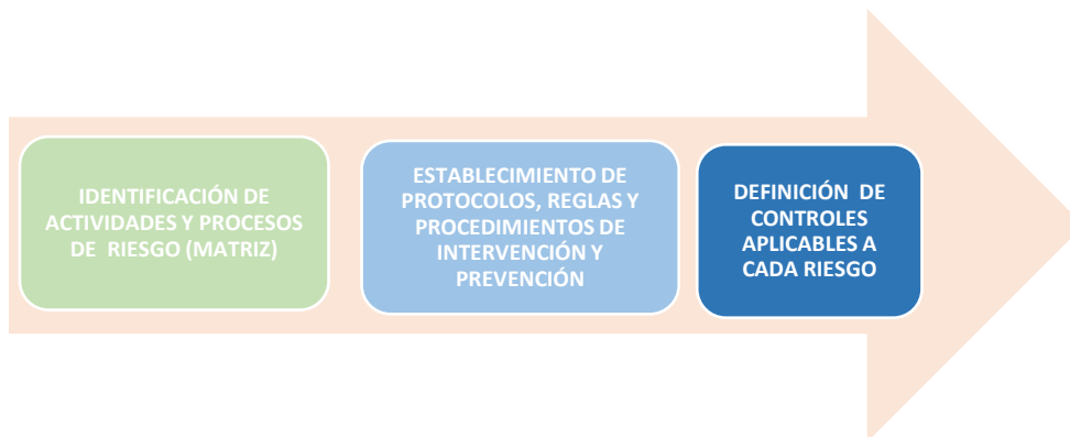
CUADRO 3: PROCEDIMIENTO DE IDENTIFICACION Y REACCION ANTE RIESGOS

La identificación, análisis y evaluación del riesgo de comisión de dichos delitos deberán quedar plasmados en una Matriz de Riesgos que deberá ser revisada anualmente o cuando sucedan modificaciones importantes en la regulación o las condiciones de operación de la Empresa.